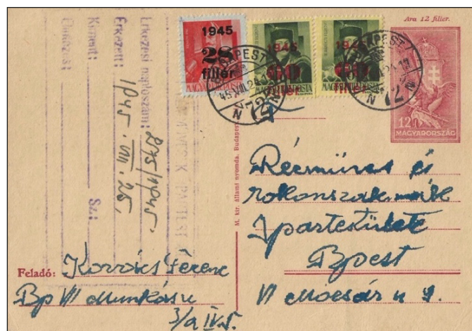
Figure 3 : tarif local 1,60 Pengö : carte de 12 fillér + timbres surchargés 2 x 60 + 28 fillér. Carte postale oblitérée du 24 août 45.

Les tarifs postaux ont augmenté une nouvelle fois le 2 juillet, le tarif local passant à 1,60 Pengö (160 fillér) (Fig.3) et le tarif intérieur passant à 2 Pengö (200 fillér). Beaucoup de cartes postales avaient été préparées pour le tarif précédent par les bureaux de poste et buralistes, aussi il ne restait plus qu'à ajouter les timbres complémentaires. Soit des timbres-poste surchargés, soit des petites valeurs en fillér.