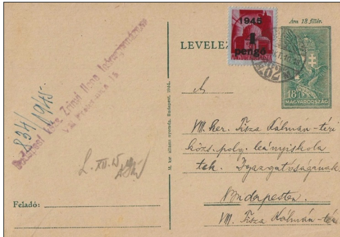
Figure 5 : local : 4 Pengő. La valeur faciale de 18 f n'est pas prise en compte.