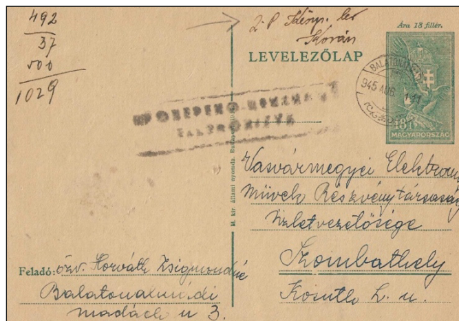
Figure 4 : tarif intérieur 2 Pengö : carte de 18 fillér. Paiement en espèces : 2 Pengö. Carte postale oblitérée du 1 er août 45.

Suite à la pénurie de timbres complémentaires, le paiement en espèce a été autorisé dès le mois de juin. Afin de pouvoir comptabiliser ces recettes, un nouveau règlement a été édicté le 1 er août 1945, stipulant qu'un paiement en espèces devait être noté sur l'envoi en inscrivant le montant perçu avec la signature du préposé postal, et en appliquant le timbre à date de la ville accompagné de son numéro de contrôle. Les paiements en espèces furent d'abord autorisés jusqu'au 31 août 1945, à titre de mesure temporaire, puis prolongés jusqu'au 31 décembre 1945, mais uniquement pour le courrier intérieur (Fig.4).