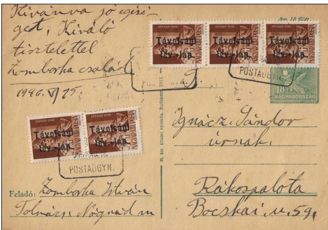
Figure 12 : 6 millions de Pengő. Chaque timbre représente une valeur faciale de 1,2 M Pengő.