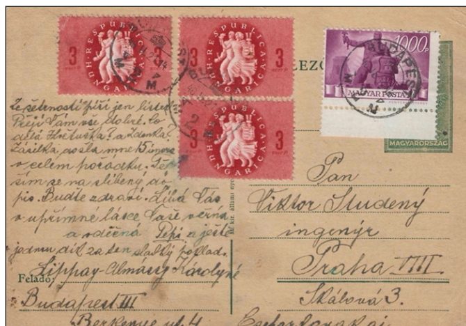
Figure 17 : carte pour la Tchécoslovaquie du 21 février. Tarif 10000 Pengö.