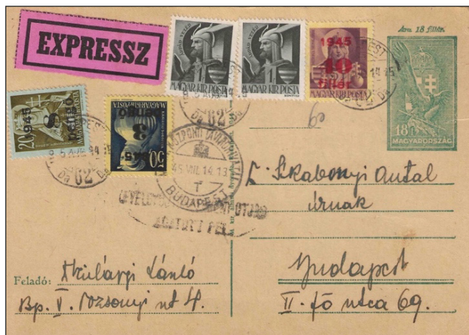
Figure 16 : tarif intérieur : 1,60 Pengö Express : 10 Pengö (2 x 1f + 40 f) + vignette 18 f + (3P + 8 P).