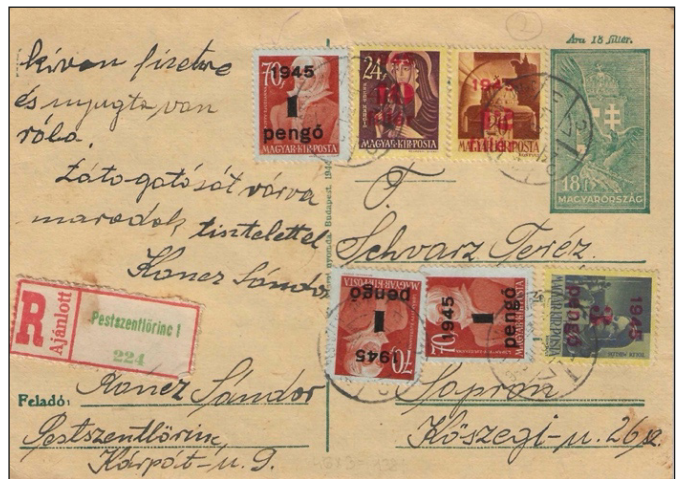
Figure 14 : tarif intérieur : 2 Pengő (1 p + 40f + 42f) + vignette 18 f. Recommandation : 5 Pengő.