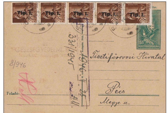
Figure 10 : tarif intérieur 2000 Pengő. Chaque timbre représente une valeur faciale de 400 Pengő.