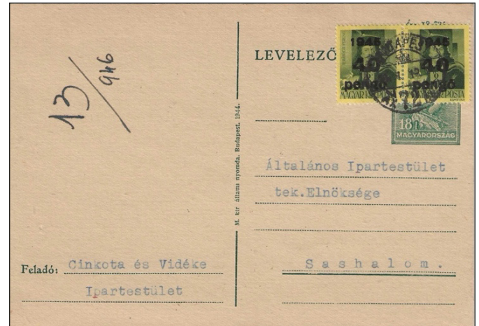
Figure 8 : tarif intérieur 80 Pengő : 2 timbres à 40 Pengő.