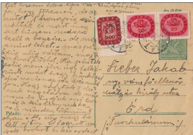
Figure 13 : 240 millions de Pengő : 1 timbre de 200 M Pengő + 2 timbres de 20 M Pengő.