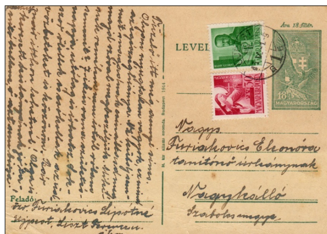
Figure 2 : 1 er mai, premier jour du tarif intérieur : 60 fillér. Carte de 18 f + 42 fillér (30 + 12 fillér).

En mai 1945, il ne restait plus que les cartes à 12 fillér et 18 fillér au type « Turul » (oiseau mythologique de la Hongrie) dans les bureaux de poste. Elles étaient encore disponibles en quantité suffisamment importante pour justifier l'utilisation de ces cartes moyennant l'adjonction de timbres supplémentaires. Ainsi le 1 er mai 1945 le tarif des cartes postales pour le tarif local est de 40 fillér (Fig.1) et de 60 fillér (Fig.2) pour le tarif intérieur. Après l'utilisation des timbres de faibles valeurs pour compléter l'affranchissement, 2 timbres ont été surchargés respectivement à 18 et 42 fillér à partir du 1 er juin.