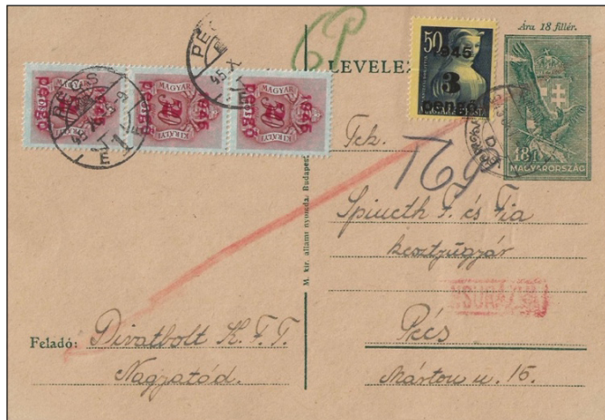
Figure 6 : tarif intérieur : 6 Pengő. (carte taxée au double du manque d'affranchissement).