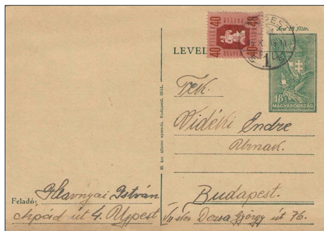
Figure 19 : carte postale du 19 octobre 46 affranchie avec le nouveau timbre de 40 f.

Le 1 er août 1946, cette inflation se termine par l'introduction d'une nouvelle monnaie, le forint au taux de 1 forint pour 4 \times 10^{29} Pengö. Cette monnaie met fin à l'une des périodes d'hyperinflation les plus extrêmes de l'histoire de la Hongrie (Fig.19).