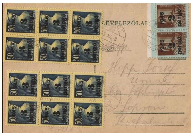
Figure 7 : carte oblitérée du 8 novembre 1945. Tarif intérieur 40 Pengő : 12 timbres à 3 Pengő + 2 timbres à 4 Pengő. La vignette imprimée non valide est masquée par les timbres.