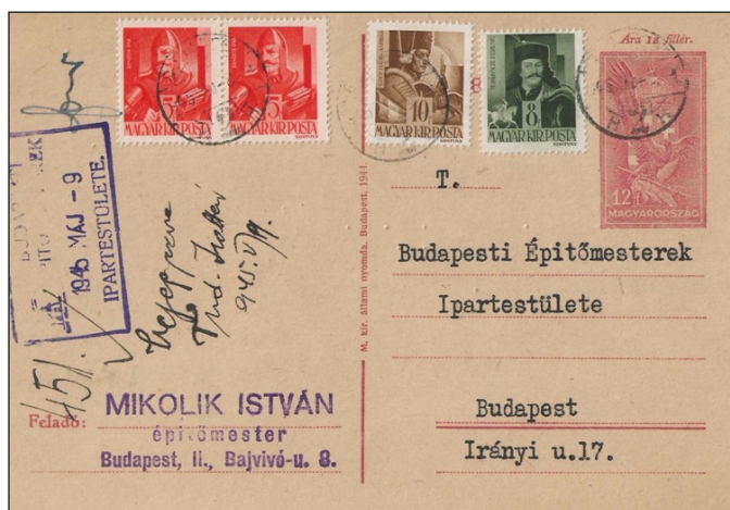
Figure 1 : tarif local du 1 er mai : 40 fillér. Carte de 12 f + 28 fillér (2 x 5 + 10 + 18 fillér).

Le 30 octobre, les cartes postales au type « Turul » perdent définitivement toute validité et deviennent de simples cartes dépourvues d'affranchissement.