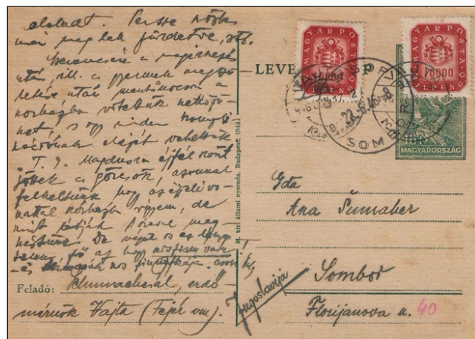
Figure 18 : carte pour la Yougoslavie du 17 juin. La carte a été écrite le 15 juin avant le changement de tarif. L'expéditeur a timbré à 20 milliards au lieu de 10 mais pas assez au regard du nouveau tarif : 50 milliards. Timbre à date d'arrivée du 22 juin.