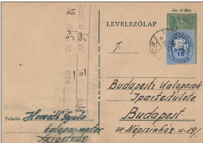
Figure 11 : tarif 15000 Pengő : timbre d'une valeur faciale de 15 ezer Pengő (1 ezer Pengő représente 1000 Pengő).